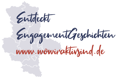
Illustration: black to wild | Lena Toschka